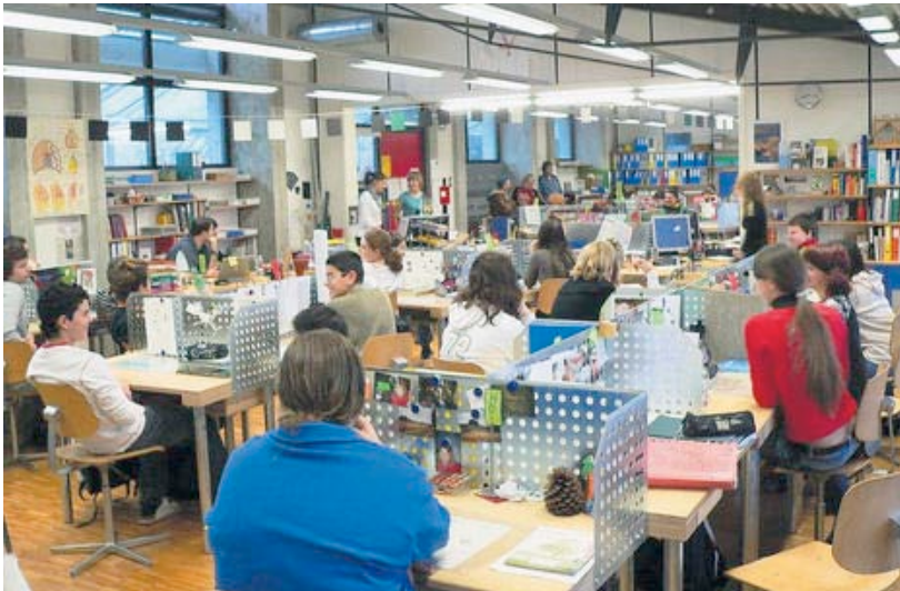
Abb.: Lernlandschaft Oberstufe Bürglen

Bürglen funktioniert ähnlich wie Alterswilten. Im Bild arbeiten zwei Klassen in der gemeinsamen Lernlandschaft zusammen. In den angrenzenden Schulzimmern finden Inputs oder Lektionen statt. 3